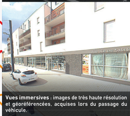
Vues immersives : images de très haute résolution et géoréférencées, acquises lors du passage du véhicule.