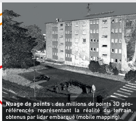
Nuage de points : des millions de points 3D géoréférencés représentant la réalité du terrain, obtenus par lidar embarqué (mobile mapping).

Système d'acquisition scan laser cinématique, couplé à une caméra sphérique pour réaliser l'acquisition d'un nuage de points de très haute densité et d'images panoramiques haute résolution. Ces données seront post-traitées pour en extraire le PCRS vecteur.